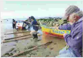
POCA, ALEJANDRO / SOTOMAYOR

se levantó el terreno en Punta Lavapié y según los investigadores, se levantó más que en Lebu. Antes casi no había playa, pero ahora hay una "tremenda", dijeron los científicos de la Universidad Austral que por estos días siguen su recorrido por las zonas costeras.